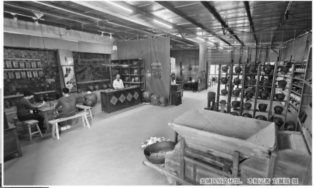
游客在特呈岛红树林拍照。