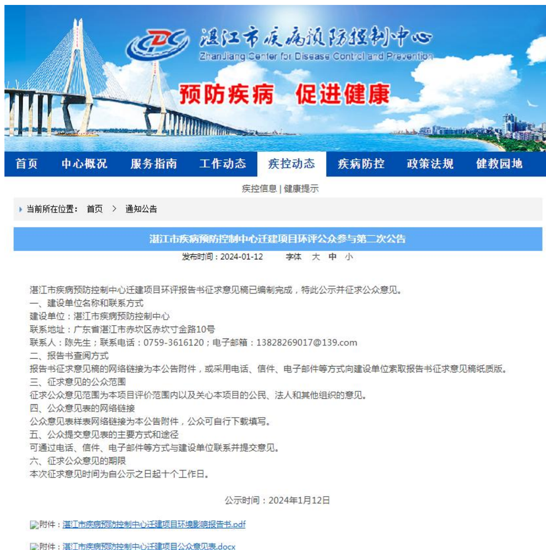
图2 征求意见稿公示截图

湛江市疾病预防控制中心迁建项目环境影响报告书征求意见稿网络公示通过湛江市疾病预防控制中心官方网站公开征求意见，湛江市疾病预防控制中心官方网站为建设单位网站，符合《环境影响评价公众参与办法》的要求。网络公示时间为2024年1月12日至2024年1月26日共10个工作日，网址为 http://www.zjcdc.cn/files/NewsHtml/b7551f48-ed28-4afc-ba91-9a46101c32e8.html ，截图见下图2。