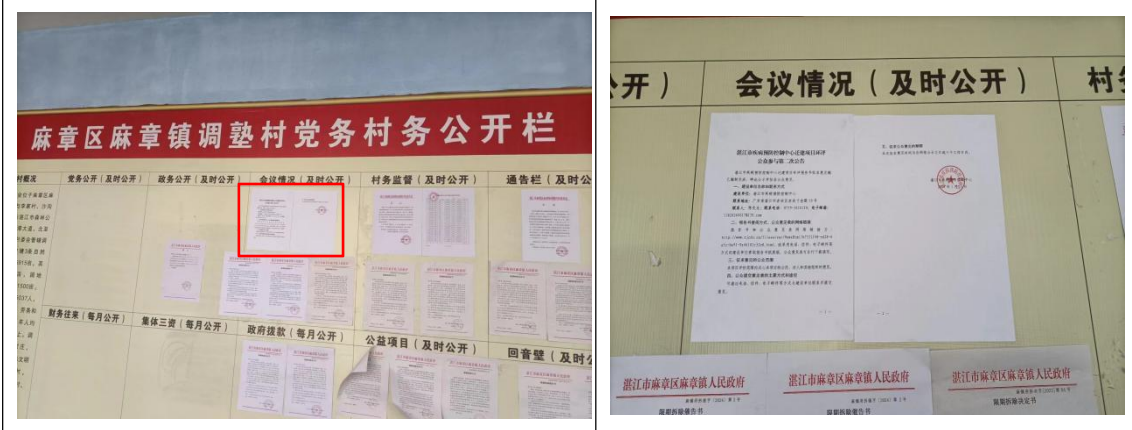
调塾村村委会张贴公告照片