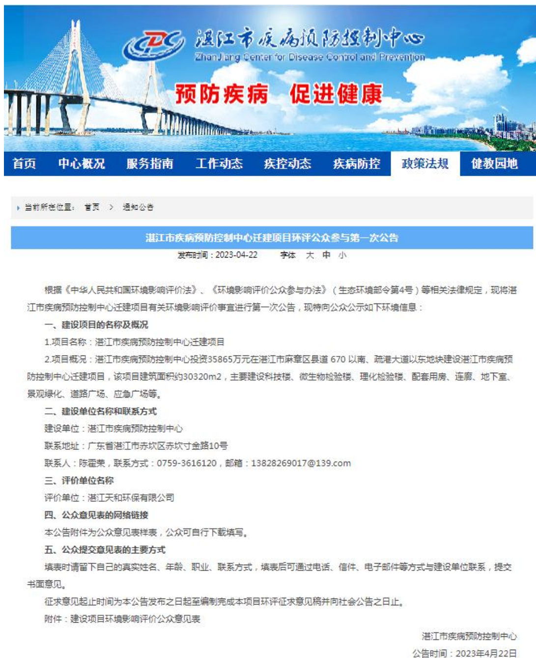
图 1 首次网络公示截图

http://www.zjcdc.cn/files/NewsHtml/e0ee9ed1-6ed0-4620-a3f4-db02c6c14796.html, 截图见下图 1。